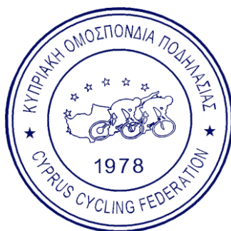
Στάυρος Γεωργίου Γενικός Γραμματέας